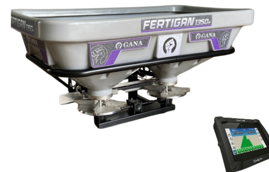
Pré disposto para taxa variável