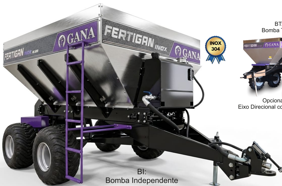
BI: Bomba Independente

Os distribuidores de arrasto são ideais para distribuição de corretivos, fertilizantes e sementes, com excelente uniformidade e qualidade. A linha de distribuidores FERTIGAN APG permite operar na distribuição com taxa fixa ou variável, de acordo com a necessidade da área, otimizando o uso de insumos.