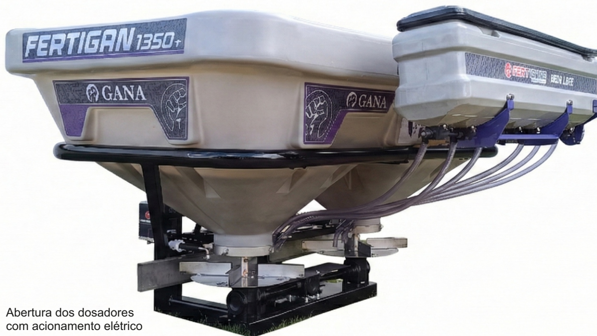
Abertura dos dosadores com acionamento elétrico

Distribuição de sementes miúdas em conjunto com a distribuição de corretivos.