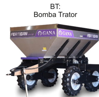
BT: Bomba Trator