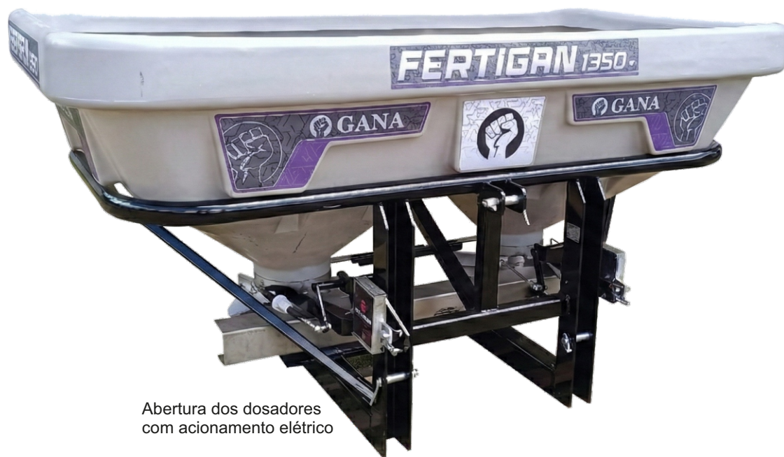
Abertura dos dosadores com acionamento elétrico

Com sistema de distribuição todo em aço inox proporcionando maior durabilidade dos componentes. Excelência na distribuição de sementes, e adubos e fertilizantes, projetado para economizar tempo e diminuir a necessidade de manutenção do equipamento.